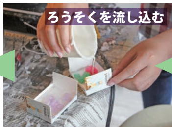
ろうそくを流し込む