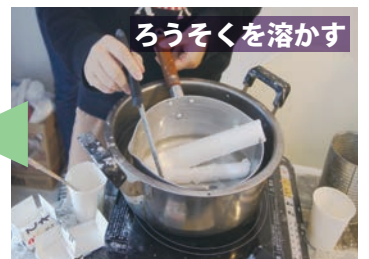
ろうそくを溶かす