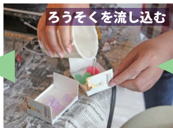
ろうそくを流し込む