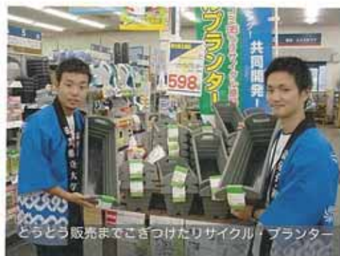
どうとう販売までこぎつけたリサイクル・ランター