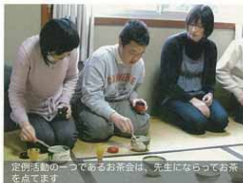
定例活動の一つであるお茶会は、先生になってお茶を点てます