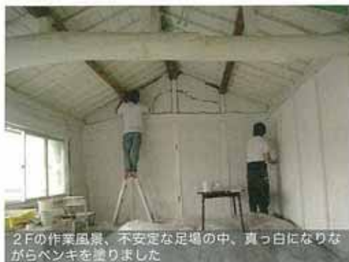
2Fの作業風景、不安定な足場の中、真っ白になりながらベンキを塗りました