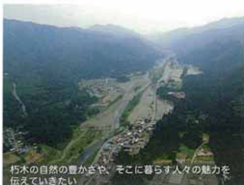
朽木の自然の豊かさや、そこに暮らす人々の魅力を伝えていきたい