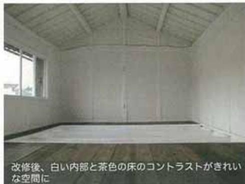
改装後、白い内部と茶色の床のコントラストがきれいな空間に