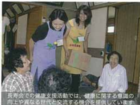
長寿会での健康支援活動では、健康に関する意識の向上や異なる世代と交流する機会を提供しています