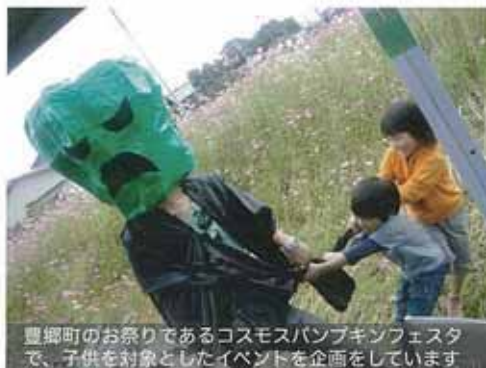
豊郷町のお祭りであるコスモスパンキンフェスタで、子供を対象としたイベントを企画をしています