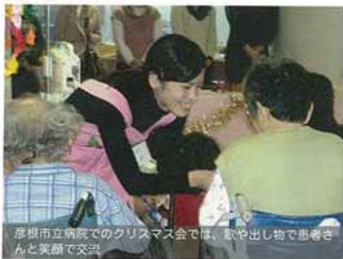
彦根市立病院でのクリスマス会では、歌や出し物で患者さんと笑顔で交流

私たちは、人間看護学部所属する学生らが中心となり、地域住民や医療現場で働く方々と交流しながら、看護における対人関係の意義を学ぶことを目的に活動しています。これまでの4年間の活動を通じて得ることができた、医療や看護に対する多様な地域のニーズに対し、今年も彦根市立病院小児病棟等での「定期的なボランティア活動、湖風祭への「子ども広場」の出展、長寿会での健康支援活動などに取り組みます。学生ならではの視点で地域を捉えながら、人が人として生きていくための生き方を支える「未来の看護のあり方」について模索していきます。