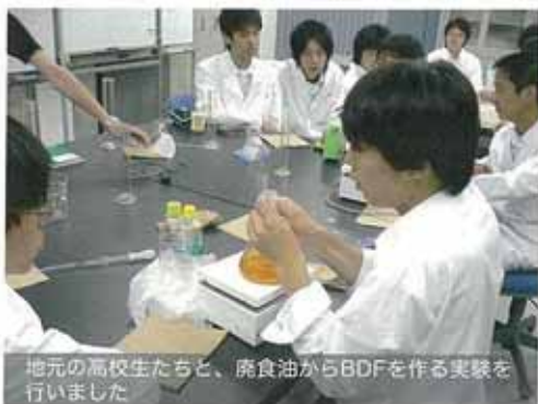
地元の高校生たちと、廃食油からBDFを作る実験を行いました