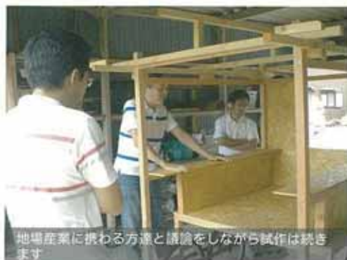
地場産業に携わる方達と議論をしながら試作は続きます