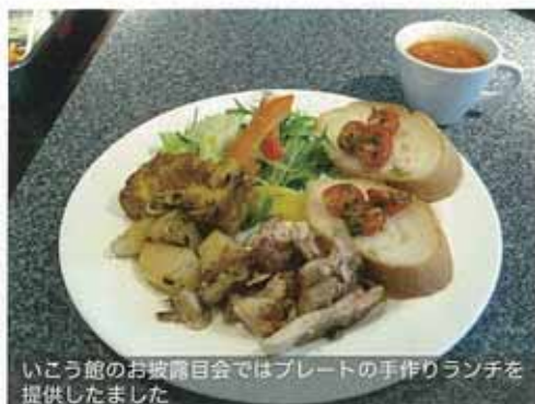
いこう館のお披露目会ではプレートの手作りランチを提供しました