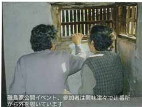
磯島家公開イベント、参加者は興味津々で辻番所から外を覗いています。