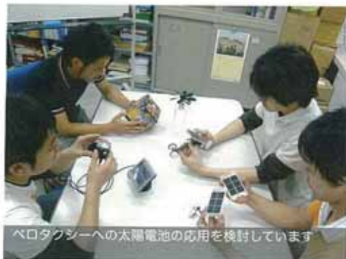
ペロタクシーへの太陽電池の応用を検討しています

2007年より彦根市内で運行されている自転車タクシー。主に人力によって動くこの“ペロタクシー”には、坂道などのために電動アシストシステムが搭載されています。私たちは二酸化炭素(CO2)を出さない環境にやさしい太陽電池を使って、その充電を行う「ソーラーペロタクシー」を開発し、それを普及させることを目的として活動します。初年度となる今年度は、主にペロタクシーへの太陽電池の設置とともに、電力やCO2の削減量の測定と検証を行います。こうした活動を通じて、環境に調和したエネルギー源である太陽電池についてアピールし、エネルギー環境問題への関心を高めていきます。