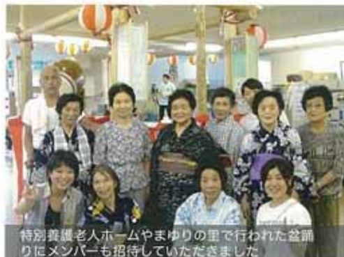
特別養護老人ホームやまゆりの里で行われた盆踊りにメンバーも招待していただきました