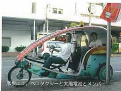
彦根にて、ペロタクシーと太陽電池とメンバー