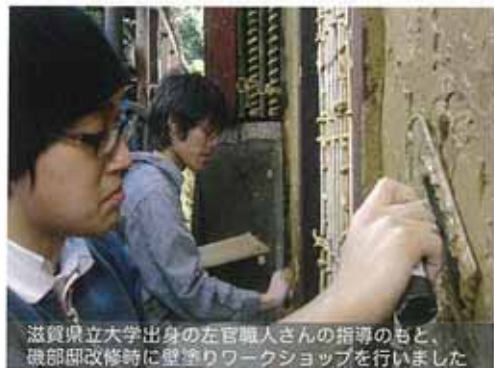
滋賀県立大学出身の左官職人さんの指導のもと、磯部邸改修時に壁塗りワークショップを行いました

私たちは、高齢化や若者の町外への流出などに悩む豊郷町を楽しく活気ある町へと蘇らせることを目的に、古民家などの改修や、イベントの実施などに取り組んでいます。これまで、利用されなくなった町内の7件の古民家や空き蔵をコミュニティハウスやバーへ改修し、活用してきました。5年目を迎える今年度は、個々の物件ではなく、町内でも比較的古い町並みの残る愛知神社付近の"通り"を対象として、ハード面、ソフト面の整備を行う長期計画に着手します。古民家などを利用したカフェやギャラリーなどを設置し、それらを通して町内外の人々と交流しながら、豊郷町をより魅力的な町へと変貌させます。