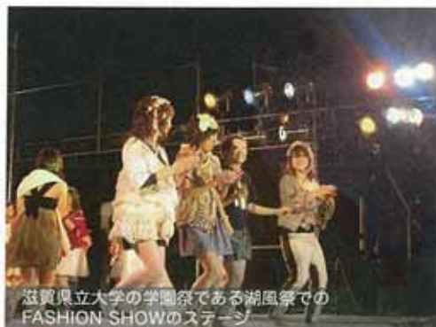
滋賀県立大学の学園祭である湖風祭での FASHION SHOWのステージ

昨年で11年目を迎えた「ファッションショー」。これまで、ショーだけではなく、ショーの服の展示や服に使用した生地を紹介を通して、豊かな滋賀の繊維産業を私たち自身が学ぶ活動と同時に、滋賀の地に住む市民の方々に地域産業を知っていただく場を提供しました。今年度は、地域や会場との“交流”や“一体”テーマに、地域の素材を身近に感じてもらうためのワークショップや、観客と一体となれるようなショーを開催します。“生活デザイン”という、暮らしの中のあらゆるモノを幅広く学んでいる私たちならではの視点で、地域の人々とより一体となって楽しめる空間や時間をデザインしていきます。