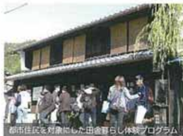
都市住民を対象にした田舎暮らし体験プログラム

現在、滋賀県湖北地域では、少子高齢化や過疎化による地域衰退に起因する空き家の増加や空き家の解体が進んでいます。一方、都市住民の間で田舎暮らしへの関心が高まりつつあるものの、そのきっかけづくりや情報発信などがまだ十分とは言えない状況にあります。私たちは、昨年度に引き続き、北国街道木之本町の中山間地域において、地域資源や空き家調査を実施し、空き家情報のデータベース化を進めます。また、これらの空き民家を活用した田舎暮らし体験プログラムを企画・実施し地域活性化へつなげていきます。