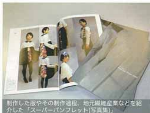
制作した服やその制作過程、地元繊維産業などを紹介した「スーパーパンフレット(写真集)」