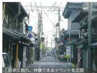
町家に触れ、体験できるイベントを企画

長浜市中心市街地では、黒壁事業などにより商業や観光の活性化が進む一方で、居住人口の伸び悩みや高齢化の進展、空き家の増加、古民家の解体に伴う歴史的景観の喪失などが問題となっています。私たちは、古民家や水路網などの長浜の歴史的景観を構成する要素の保存や活用を進めながら、緩やかな地域活性化を図ることを目的として活動します。地域住民や都市住民を対象に、実際に町家に触れ、まちなか居住を体験できるイベントを実施し、地域の空き家を活用しながら、地域再生・活性化への足がかりを探ります。