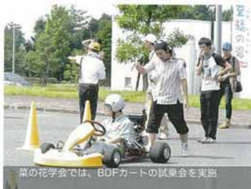
菜の花学会では、BDFカートの試乗会を実施