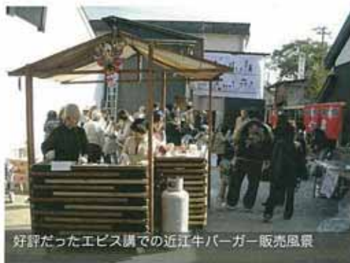
好評だったエビス講での近江牛バーガー販売風景

本プロジェクトは、食生活を専攻する学生らが中心となり、「食」という観点から彦根市を元気にするための活動を行っています。発足一年目であった2007年度は、地元産の食材を使った「近江牛バーガー」の商品開発と屋台販売を中心に活動しました。今年度は、彦根市内の橋本商店街にある「いこう館」を活動拠点とし、これまで調理・加工過程で廃棄されていた食材や、地元産の食材を使ったオリジナル和菓子の開発や、料理教室や講演会などの食育活動に取り組みます。学生ならではの視点と専門性を活かし、「食」を通じて、学生と地域、地域住民同士をつなぐ「いいいの場」を提供します。