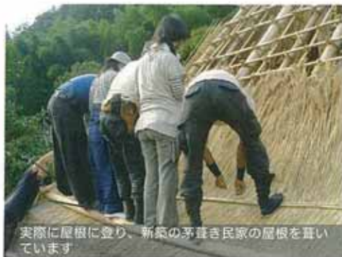
実際に屋根に登り、新築の茅葺き民家の屋根を葺いています