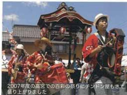
2007年度の高宮での百彩の祭りにデンドン屋もきて盛り上がりました