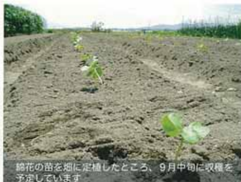
綿花の苗を畑に定植したところ、9月中旬に収穫を予定しています