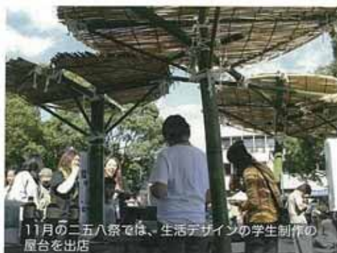
11月の二五八祭では、生活デザインの学生制作の屋台を出店