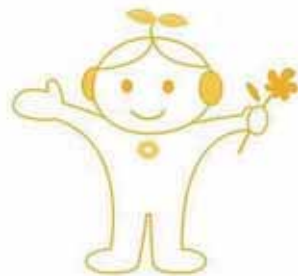
近江春産イメージキャラクター マイミー