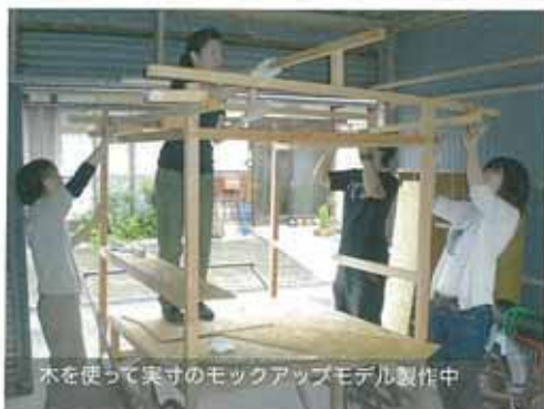
木を使って実寸のモックアップモデル製作中

彦根市には、古くから仏壇製作や縫製などの地場産業が存在しているものの、現代の日常生活ではそれらと触れ合う機会がほとんどありません。私たちは、これらの地場産業に対する認知度・親近感を高め、彦根の地域ブランド形成をバックアップすることを目的として活動します。活動の初年度となる2008年度は、仏壇産業と織維産業の技術を応用しながら、自転車生活をすすめる会が取り組む「彦根力車開発プロジェクト」で製作された「自転車力車」の改良に取り組めます。さらに、これらのイメージ調査を行いながら、デザインの分野から、「地場産業に対する認知度・親近感の向上」を探っていきます。