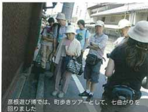
彦根遊び博では、町歩きツアーとして、七曲がりを行いました。