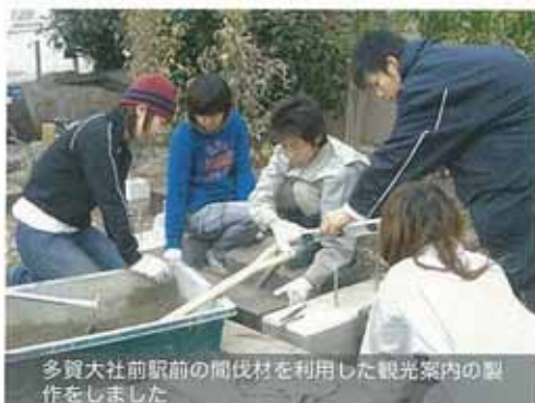
多賀大社前駅前の間伐材を利用した観光案内の製作をしました