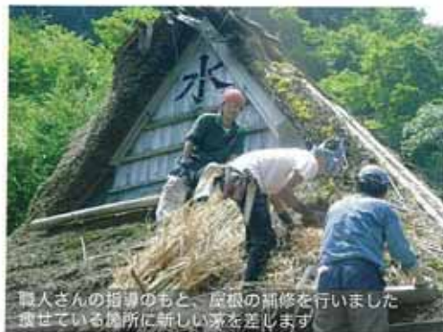
職人さんの指導のもと、屋根の補修を行いました 壊れている場所に新しい茅を差し込みます

URL： http://www.shc.usp.ac.jp/hamazaki/aboutteam/oori/oori.html