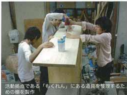
活動拠点である「もくれん」にある道具を整理するための棚を製作

私たちは、木などの自然素材を使ったものづくりを通じ、ものを作る楽しさや難しさ、大切さを学ぶと同時に、地元産の間伐材等の積極的な活用について模索することを目的に活動しています。活動5年目となった今年度は、造形活動拠点である木作業施設「もくれん」を拠点に、自然素材を使った家具や小物「木楽ブランド」の製作・展示に取り組みます。また、新たに、木工教室や近江八幡での出張ワークショップを企画・実施し、これまでの活動を広く地域へ展開していきます。年代や性別を問わず誰もが気軽に楽しめる木作業を通じて、地産池消への理解を含め、環境への意識の向上を目指します。