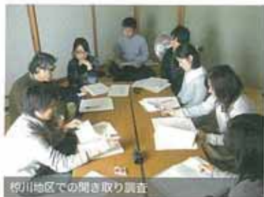
柳川地区での聞き取り調査

少子高齢化が進展する高島市において、持続可能な地域社会の運営のための若者の定住促進が喫緊の課題となっています。私たちは、高島市独自の地域性・風土・環境と若者のライフスタイルのつながりに着目しながら若者へヒアリング調査を行い、その分析によって高島市の可能性を探っていきます。また、それらを元に若者定住を目的としたPR媒体の制作に取り組みます。高島の可能性について、若者である学生ならではの視点で掘り起こしながら、若者の未来に向けた、高島の地域特性を生かした生活スタイルを検討します。