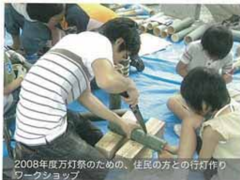
2008年度万灯祭のための、住民の方との行灯作りワークショップ

私たちは、多賀・湖東地域をフィールドに、町が抱えるニーズや課題について地域と共に考え、取り組みながら、元気で個性あるまちを作ることを目的に活動しています。建築デザインを学ぶ学生が中心となった本プロジェクトでは、これまで、地元間伐材を活用した休憩所の整備や、地元の万灯祭への企画・参加などに継続して取り組んできました。今年度は、「まち」によるまちづくりの実現を目指して、活動のプロセスや成果などの「情報発信」に重点的に取り組みます。まちづくりをテーマにしたホームページなどからの情報発信を通じて、より多くの地元住民を巻き込みながら、多賀のまちづくりを盛り上げます。