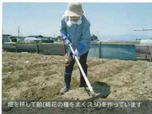
畑を耕して畝(綿花の種をまくスジ)を作っています

彦根市稲枝町本庄地域の綿花栽培は、現在、後継者不足や資金不足など様々な課題を抱えています。本プロジェクトでは、地元住民や「みずの郷いなか体験さわ」と連携しながら、若い労働力と染織の学術・技術的な知識といった専門性を活かし、綿花栽培の復興を支援します。活動の初年度となる今年度は、放置田畑を利用した綿花の栽培や糸づくり、染色などの取り組みを通じて、自然素材の製造過程や先人達の知恵や手作業を学びます。また、それらの各作業を地元小学生の体験学習講座として実施し、地域に根ざした綿花栽培の技術と文化を未来に伝えることを目指します。