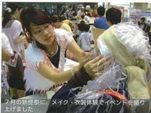
7月の妖怪祭に、メイク・衣装体験イベントを盛り上げました