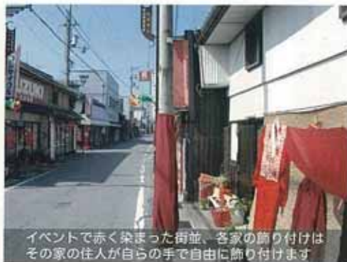
イベントで赤く染まった街並、各家の飾り付けはその家の住人が自らの手で自由に飾り付けます