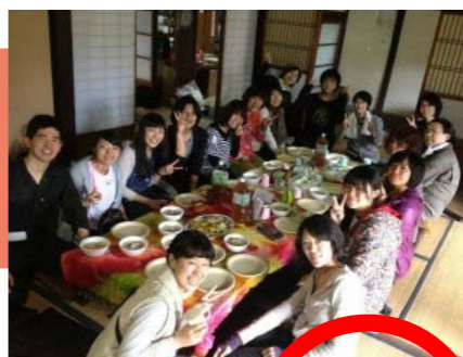
食卓イベント Special 4月21日