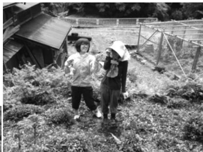
←一回生の新メンバー