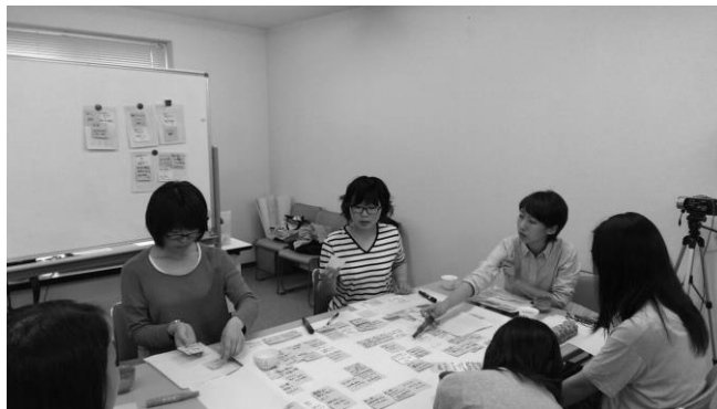
↑ 真剣に話し合い中です。